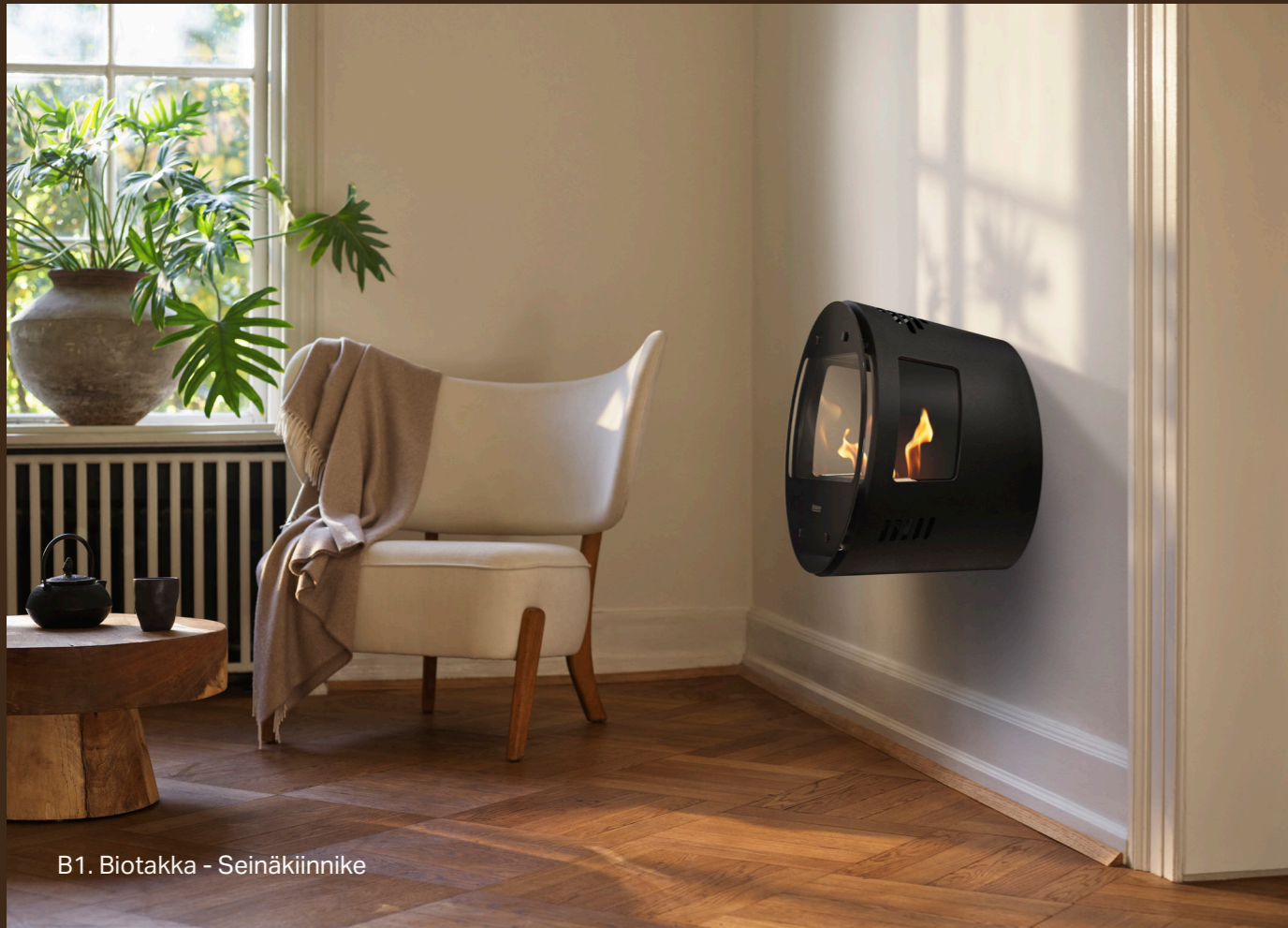
B1. Biotakka - Seinäkiinnike