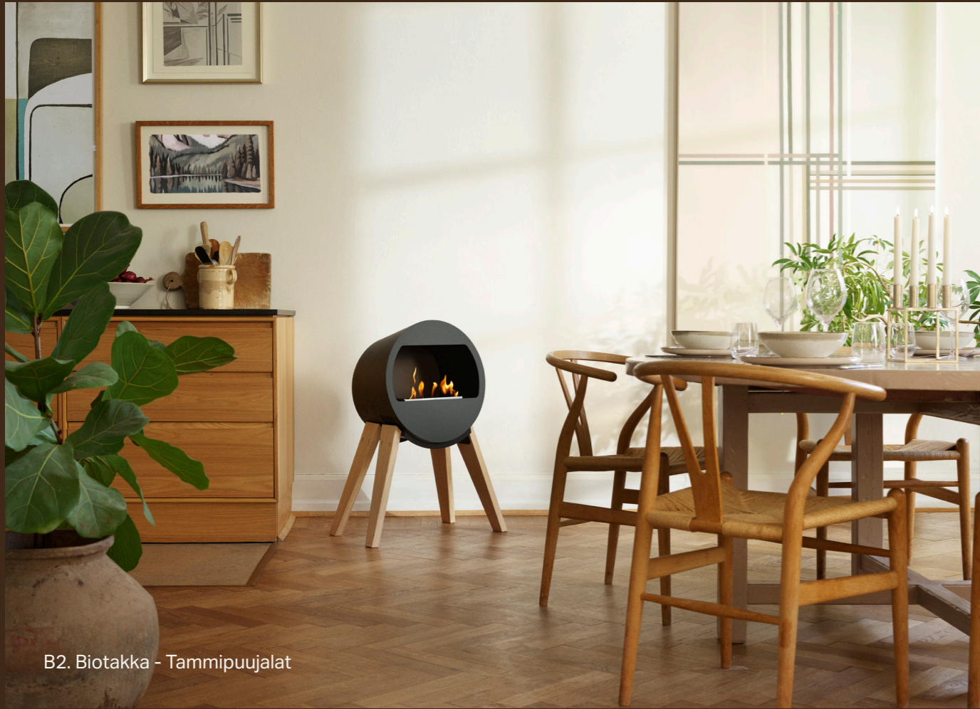
B2. Biotakka - Tammipuujalat