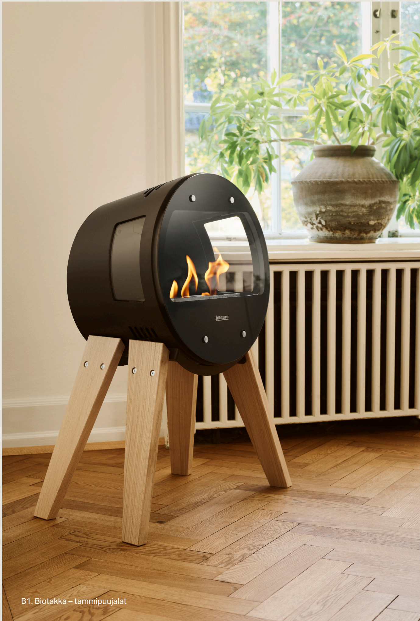
B1. Biotakka – tammipuujalat